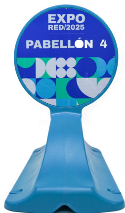
GRAFICA SOBRE REFLECTIVO