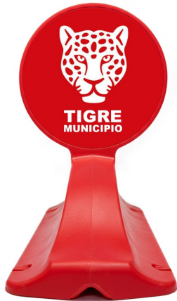
GRAFÍA SOBRE VINILO